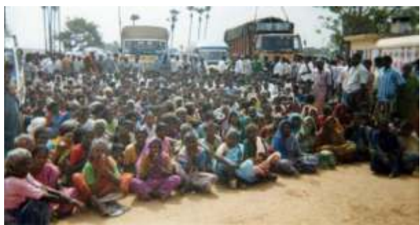
ਸਮੱਗਰੀ ਵੰਡਣ ਸਮੇਂ ਤਾਮਿਲ ਲੋਕਾਂ ਦਾ ਇਕੱਠ।