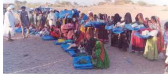
ਟੈਂਟ ਵੰਡਦੇ ਹੋਏ।