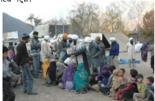
ਵੰਡਣ ਸਮੇਂ ਦੇ ਦ੍ਰਿਸ਼।