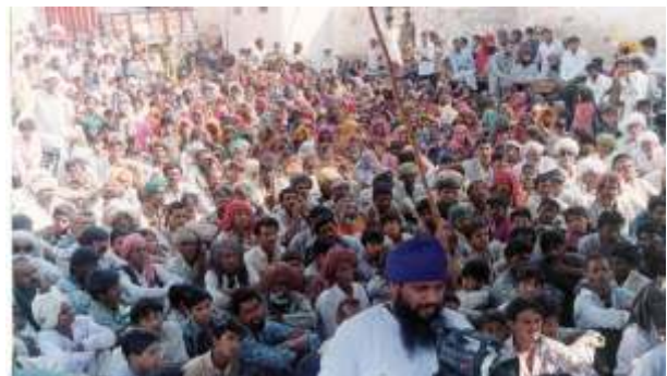
ਵਿਦਾਈ ਸਮੇਂ ਇਕੱਠ।