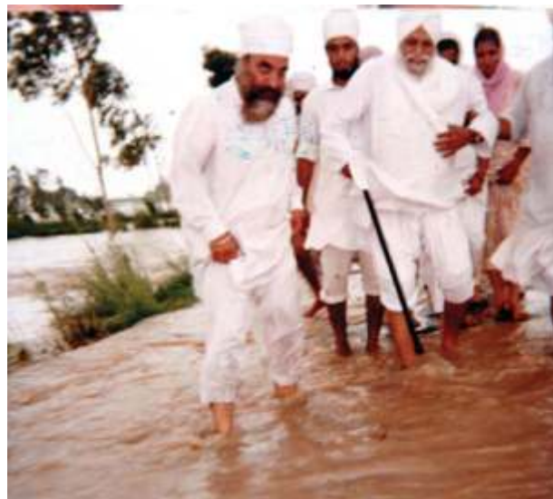
ਸੰਤ ਮਹਾਰਾਜ ਆਪ ਪਿੰਡਾਂ ਦਾ ਜਾਇਜ਼ਾ ਲੈਂਦੇ ਹੋਏ।

26 ਜਨਵਰੀ 2001 ਨੂੰ ਗੁਜਰਾਤ ਵਿਚ ਆਏ ਭੁਚਾਲ ਦੀ ਤਬਾਹੀ ਨੂੰ ਸੁਣ ਕੇ ਮਹਾਂਪੁਰਸ਼ਾਂ ਦੀ ਨੀਂਦ ਉਡ ਗਈ ਤੇ ਇਹ ਇਕੋ ਵਿਚਾਰ ਸੀ ਕਿ ਜਲਦੀ ਤੋਂ ਜਲਦੀ ਸਹਾਇਤਾ ਸਮੱਗਰੀ ਪੁੱਜ ਜਾਵੇ। ਇਸ ਮੰਤਵ ਲਈ ਪਹਿਲੀ ਕਿਸ਼ਤ ਵਿਚ 17 ਟਰੱਕ ਤੇ ਦੂਜੀ ਕਿਸ਼ਤ 33 ਟਰੱਕ ਗੁਜਰਾਤ ਲਈ ਅਰਦਾਸ ਕਰਕੇ ਰਵਾਨਾ ਕੀਤੀ ਗਈ।