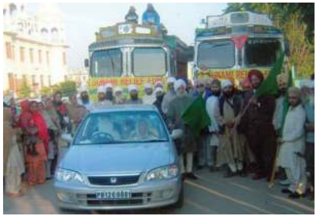
ਤਾਮਿਲਨਾਡੂ ਨੂੰ ਸੂਨਾਮੀ ਸਮੇਂ ਟਰੱਕ ਤੋਰਨ ਸਮੇਂ ਦਾ ਦ੍ਰਿਸ਼।

ਸੇਵਾ ਕਾਰਜ ਕਰ ਰਹੇ ਅਫਸਰਾਂ ਕਰਮਚਾਰੀਆਂ ਤੋਂ ਇਲਾਵਾ ਉਚੇਚੇ ਤੌਰ ਤੇ ਭਾਰਤ ਵਰਸ਼ ਕੇਂਦਰੀ ਗੈਸ ਅਤੇ ਪੈਟਰੋਲੀਅਮ ਮੰਤਰੀ ਮਨੀਸ਼ਕਰ ਆਈਅਰ ਲੰਗਰ ਚੱਲਣ ਵਾਲੀ ਜਗ੍ਹਾ ਸਮੁੰਦਰੀ ਕਿਨਾਰੇ ਪ੍ਰਮੁਖਗਾਰ ਰੈਸਟ ਹਾਊਸ ਵਿਖੇ ਪਹੁੰਚੇ ਅਤੇ ਉਹਨਾਂ ਵੱਲੋਂ ਆਪਣੇ ਸਾਥੀਆਂ ਸਮੇਤ ਲੰਗਰ