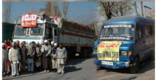
ਜੰਮੂ ਅਤੇ ਕਸ਼ਮੀਰ ਨੂੰ ਸਮੱਗਰੀ ਸਮੇਤ ਤਿਆਰ ਟਰੱਕਾਂ ਦਾ ਇੱਕ ਦ੍ਰਿਸ਼।