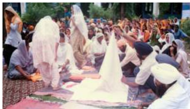
ਸਕੂਲ ਦੇ ਬੱਚੀਆਂ ਵਾਸਤੇ ਵਰਦੀਆਂ ਦਾ ਪ੍ਰਬੰਧ ਕਰਦੇ ਹੋਏ।