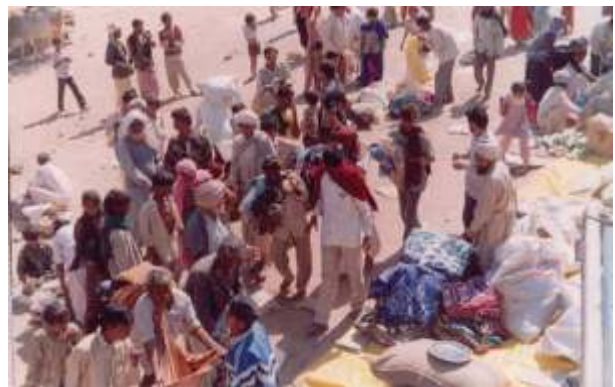
ਅਨਾਜ ਵੰਡਣ ਸਮੇਂ ਦਾ ਇਕ ਦ੍ਰਿਸ਼।