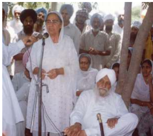
ਬੀਜੀ ਪਿੰਡਾਂ ਦੇ ਲੋਕਾਂ ਨੂੰ ਧਰਵਾਸ ਦੇ ਰਹੇ ਹਨ।