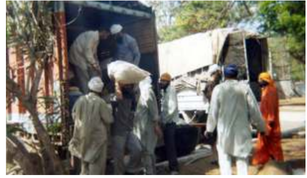
ਸਿੰਘ ਸੇਵਾ ਵਿਚ ਤੱਤਪਰ।