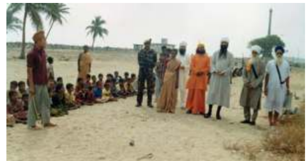
ਸਮੁੰਦਰ ਦੇ ਕੰਡੇ ਤਾਮਿਲਨਾਡੂ ਵਿਖੇ ਬਾਬਾ ਜੀ ਸਿੰਘਾਂ ਸਮੇਤ ਦੁਖੀ ਲੋਕਾਂ ਦੀ ਸੇਵਾ ਵਿਚ।